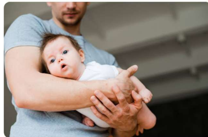
Ղեկուններ 9, 2024 Կենտրոնական հիպոտոնիա Այսօրվա թեման ներառում է ուղեղային հիպոտոնիայի, կենտրոնական հիպոտոնիայի, բարորակ բնածին հիպոտոնիայի և թույլ նորածին (floppy infant) մասին քննարկում:

Սկսած 2007թ.-ից Ասոցիացիան կանոնավոր մասնակցում է Եվրոպական մանկաբուժական ասոցիացիայի, Մանկաբուժական միությունների Եվրոպական ակադեմիայի, ինչպես նաև Համաշխարհային մանկաբուժական ասոցիացիայի աշխատանքներին՝ որպես լիիրավ անդամ: Ասոցիացիայի ներկայացուցիչները մասնակցում են Միջազգային և Եվրոպական Գլխավոր ասամբլեաների աշխատանքներին, ընդհանուր քաղաքանության մշակմանը, ընտրություններին, Եվրոպական ասոցիացիայի կողմից իրագործվող միջազգային ուսումնասիրություններին: