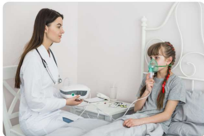
Փոկվար 7, 2025 Երեխաների թոքերի ինտերստիցիալ հիվանդություն Երեխաների թոքերի ինտերստիցիալ հիվանդությունները (ԵԹԻՀ) շեշտառական հիվանդությունների տարատես խումբ են, որոնք ախտահարում են թոքերի ինտերստիցիումի, մազանոթների, ավելոների և պերիպլեուրալիս հյուսվածքի վրա: